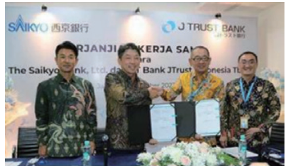
2023年10月10日 現地で開催された調印式の様子