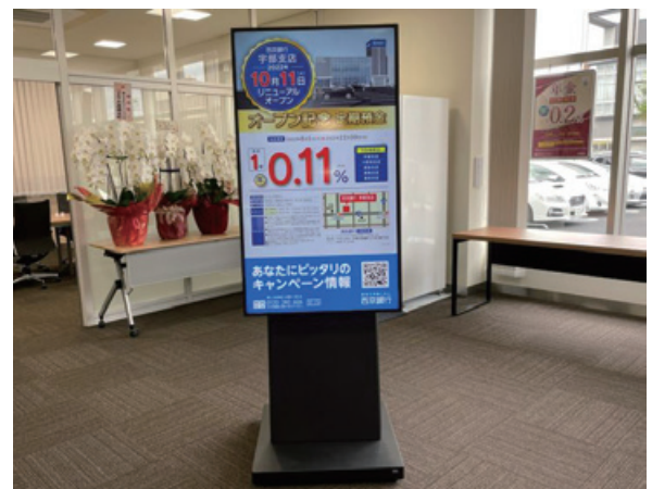
営業店ロビーに設置したデジタルサイネージ