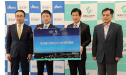
2022年9月20日 共同記者会見の様子