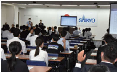
本店で開催したインターンシップの様子