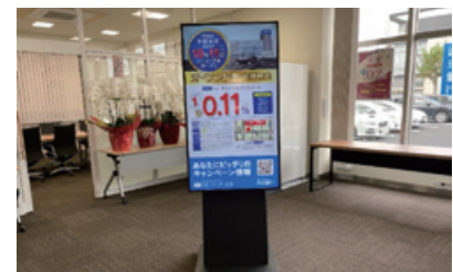
デジタルサイネージの導入