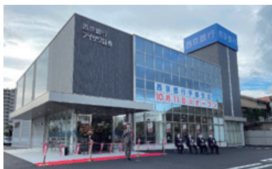
2022年10月11日 新宇部支店オープン