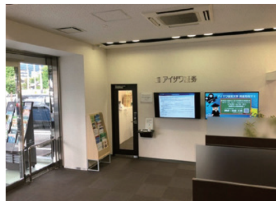
山口支店のロビーに設置したアイザワ証券プラザ