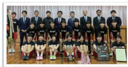
優勝報告会の様子 (当行から30万円、ACTから5万円を贈呈)