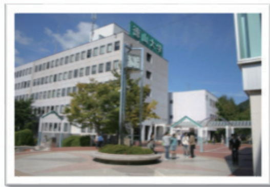
公立大学法人周南公立大学（旧 徳山大学）