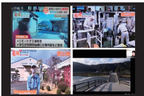
(オンラインによる企業訪問・観光)