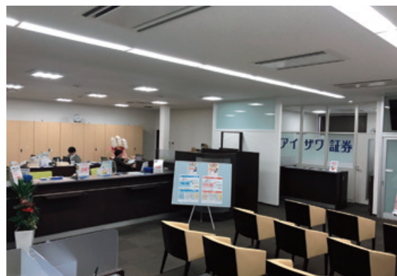
銀行と証券のサービスを集約したロビー