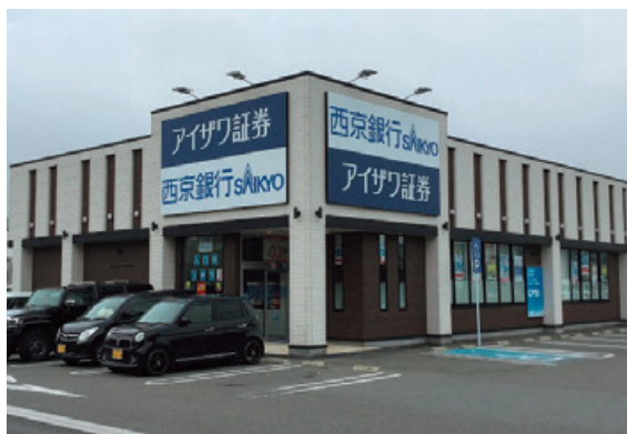
西京銀行幡生支店外観