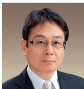
取締役頭取（代表取締役）