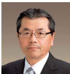
取締役副頭取（代表取締役）