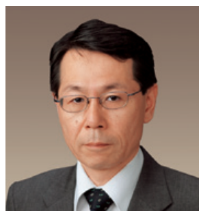
専務取締役（代表取締役）