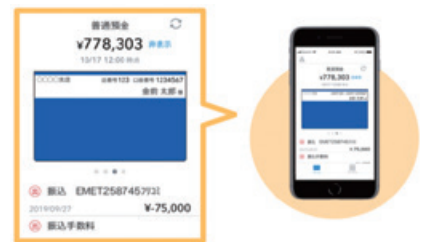
アプリの画面イメージ